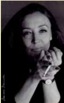
אוריאנה פאלאצ'י (1929-2006)

4. אני מתביישת שהטלוויזיה שלנו "בוכה" רק על ההרוגים הערבים ואת הקורבנות היהודים אינה מזכירה כלל. 5. אני מתביישת במפלגות השמאל (שלצידן נלחמתי שנים רבות) אינם מזכירים את תרומתם הרבה של יהודי איטליה במלחמה נגד הנאצים, אותם יהודים, שנכדיהם פוחדים היום על חייהם בערי איטליה, בלגיה וצרפת. 6. זה מביש, שבשם ישו הקדוש, (אגב, יהודי שבלעדיו לא הייתה היום עבודה ועושר לכנסייה הקתולית) מאיימים עלי ורוצים להעניש אותי; ואוריאנה פאלאצ'י מסכמת ואומרת: "אבל אני לא פוחדת, ואמשיך להגן על זכותם של היהודים לחיים שלווים, גם אם אצטרך להתנגד לדעתם של כל תושבי הגלובוס