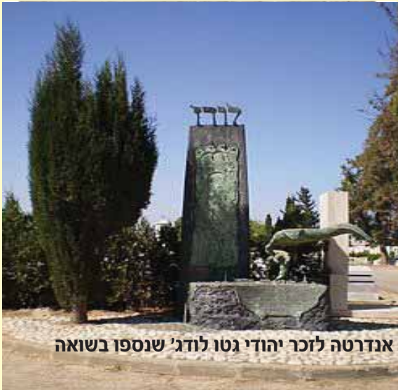
אנדרטה לזכר יהודי גטו לודג' שנספו בשואה